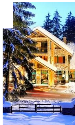
Hotel Tri Studničky****